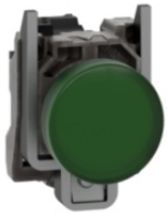
PILOTO LUMINOSO VERDE LED INTEGRADO