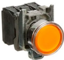
PULSADOR LUMINOSO AMARILLO CON LED INTEGRADO