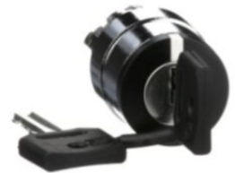
SELECTORES CON LLAVE