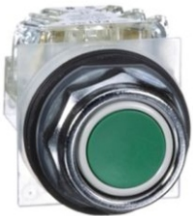
PULSADOR 30MM VERDE