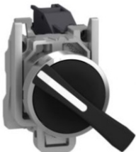
SELECTOR 3 POS MANETA LARGA