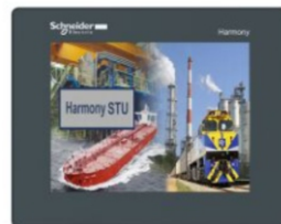
PANTALLA TACTIL A COLOR