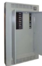
TABLEROS DE DISTRIBUCIÓN