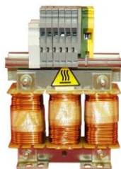
INDUCTANCIA DE LÍNEA, 100A 0,3 MH