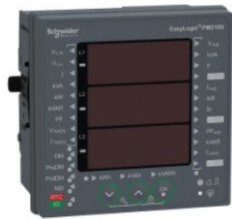
ANALIZADORES DE ENERGÍA