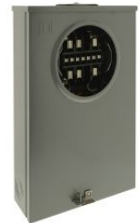
GABINETES PARA MEDICIÓN