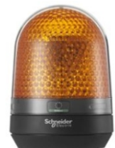
BALIZA MULTIFUNCIONAL AMBAR LED