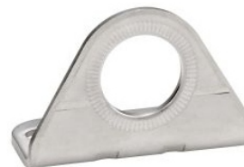
BASE DE FIJACIÓN PARA SENSOR 18MM INOX