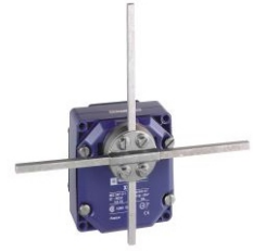
INTERRUPTOR DE FIN DE CARRERA