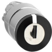
CABEZA SELECTOR DE LLAVE