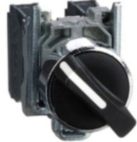
BOTÓN SELECTOR 2 POS 90°