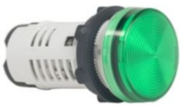
LUCES PILOTO LED