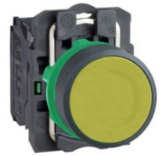
PULSADOR RASANTE AMARILLO CON CONTACTO N.A.