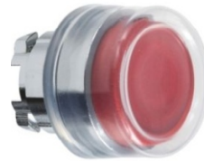
CABEZA PULSADOR GOMA ROJO