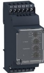
RELEVADOR DE CONTROL DE TENSION MULTIFUNCIONAL