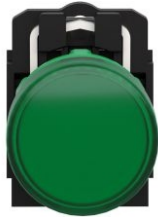
PILOTO LUMINOSO VERDE LED INTEGRADO