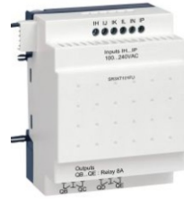
MODULO DE EXTENSION DE E/S DISCRETA