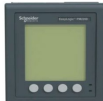
MEDIDOR DE POTENCIA Y ENERGIA