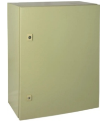
GABINETES ACERO AL CARBON