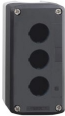
CAJA 3 ORIFICIOS GRIS