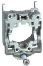
BASE METAL PARA BOTÓN 22MM