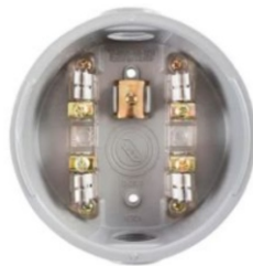
BASES DE MEDICIÓN MONOFASICA