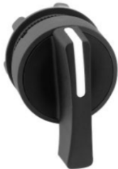
CABEZA SELECTOR 2 Y 3 POSICIONES