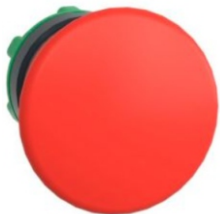
CABEZA PULSADOR ROJO