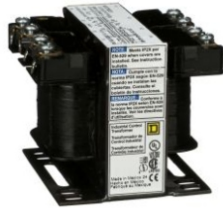
TRANSFORMADORES DE CONTROL