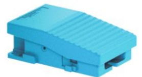
INTERRUPTORES DE PEDAL