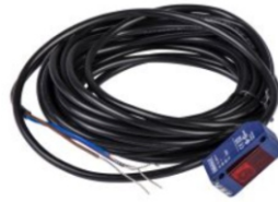
SENSORES FOTO ELECTRICOS