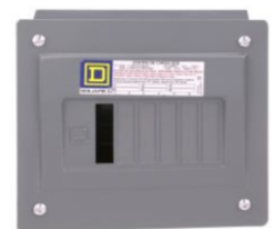
CENTROS DE CARGA SQD