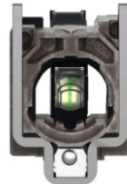
BASE METAL CON BLOQUE LUMINOSO