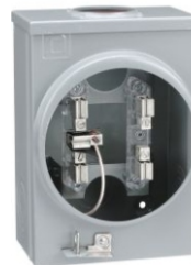
BASES UNITARIA 100A