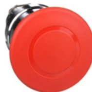
PARO DE EMERGENCIA ZB4 METAL 40MM