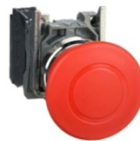
PARO DE EMERGENCIA METAL