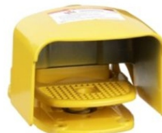
INTERRUPTORES DE PEDAL CON GUARDA