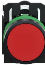
PULSADOR RASANTE ROJO