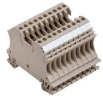
CLEMAS DE PASO