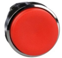
CABEZA PULSADOR ROJO