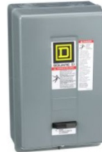
ARRANCADORES DE MOTOR