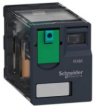
RELES OCTAL Y UNDECAL