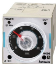
TIMER OCTAL Y UNDECAL