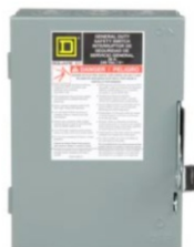
INTERRUPTORES DE SEGURIDAD