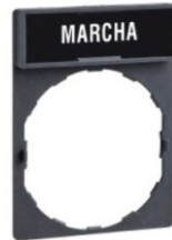
PORTA ETIQUETA CON ETIQUETA