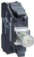
BLOQUE DE CONTACTO LED