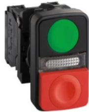
PULSADOR DOBLE ILUMINADO