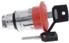
CABEZA PULSADOR DE EMERGENCIA 40MM CON LLAVE