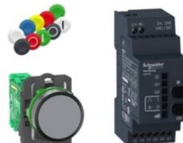
PAQUETE INALAM XB5R 22MM