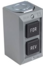
ESTACIÓN DE CONTROL SQD