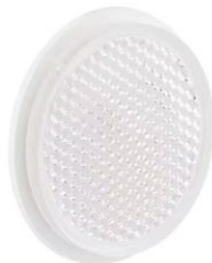
REFLEJANTE PARA SENSOR 39MM