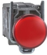
PILOTO LUMINOSO ROJO LED INTEGRADO