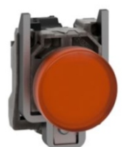
PILOTO LUMINOSO LED NARANJA