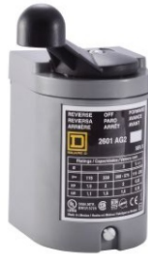
CONMUTADOR REVERSIBLE SQD