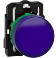
PILOTO LUMINOSO AZUL LED INTEGRADO