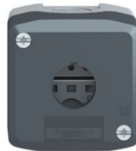
CAJA 1 ORIFICIO GRIS