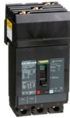
TERMOMAGNETICOS SQD 3 POLOS