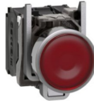
PULSADOR LUMINOSO ROJO CON LED INTEGRADO