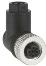
CONECTORES HEMBRA ACODADO