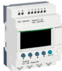
RELES INTELIGENTES MODULAR