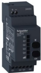
RECEPTOR PROGRAMABLE DC 4 PNP