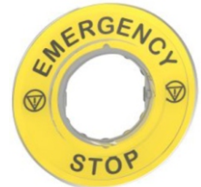
ETIQUETA EMERGENCY STOP