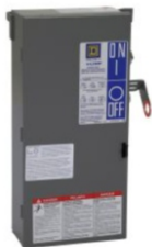
ELECTRODUCTOS CON FUSIBLE