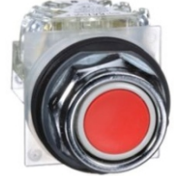
PULSADOR 30MM ROJO