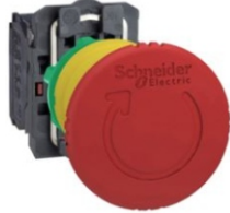
PARO DE EMERGENCIA XB5