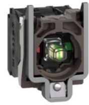
BASE METAL CON BLOQUE LUMINOSO Y BLOQUES DE CONTACTO N.C. Y N.A.