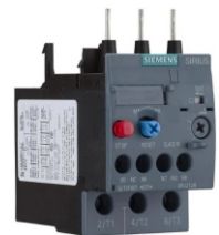
RELES BIMETALICOS SIEMENS