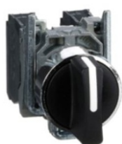
SELECTOR 3 POS XB4