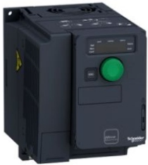
VARIADORES DE VELOCIDAD