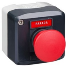
ESTACIÓN DE CONTROL COMPLETA