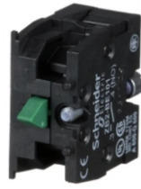
BLOQUE CONTACTO N.A.