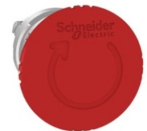
PARO DE EMERGENCIA 40MM SETA