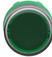
CABEZA PULSADOR ILUMINADO VERDE