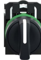
SELECTOR 3 POS MANETA CORTA