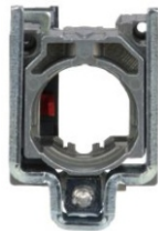
BASE METAL CON BLOQUE DE CONTACTO N.C.