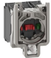
BASE CON BLOQUES DE CONTACTOS