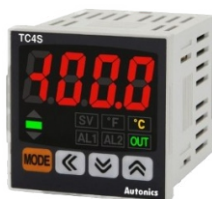
CONTROLES DE TEMPERATURA