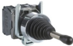
JOYSTICK 2 Y 3 POSICIONES