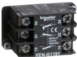
BLOQUE DE CONTACTO XENG 2 VELOCIDADES