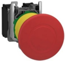
PARO DE EMERGENCIA 40MM