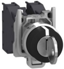
BOTÓN GIRATORIO DE LLAVE