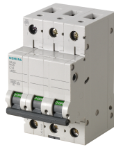
PASTILLAS RIEL DIN (1,2 Y 3 POLOS)