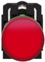
PILOTO LUMINOSO ROJO LED INTEGRADO