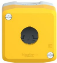
CAJA 1 ORIFICIO AMARILLO