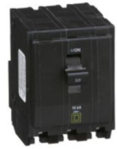
BREAKER SQD 1, 2 Y 3 POLOS