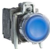
PULSADOR LUMINOSO AZUL CON LED INTEGRADO