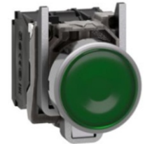
PULSADOR LUMINOSO VERDE CON LED INTEGRADO