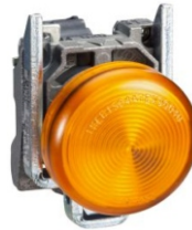
PILOTO LUMINOSO NARANJA LED INTEGRADO