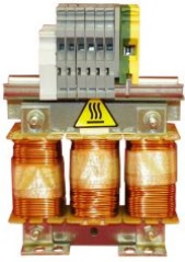
INDUCTANCIA DE LÍNEA. 1 MH, 31A, PARA VARIADOR DE VELOCIDAD