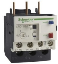
RELES BIMETALICOS SCHNEIDER