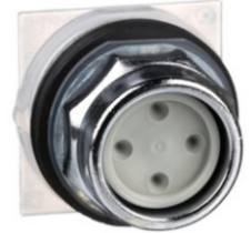
CABEZA DE PULSADOR 30MM CON SET DE 6 TAPAS