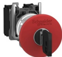
PARO DE EMERGENCIA METAL CON LLAVE 40MM