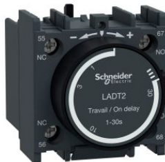
BLOQUE DE CONTACTOS TEMPORIZADOS